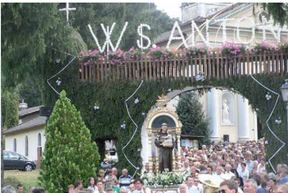
Nella foto sopra, la processione in onore del patrono, Sant'Antonio di Padova, a Fastro, nell'unità pastorale di Arsìè, nel giugno del 2010.