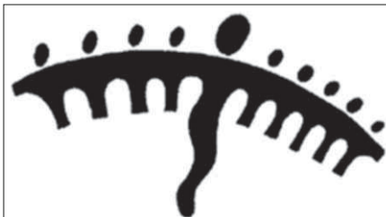
Il logo del vicariato del Bassanello.