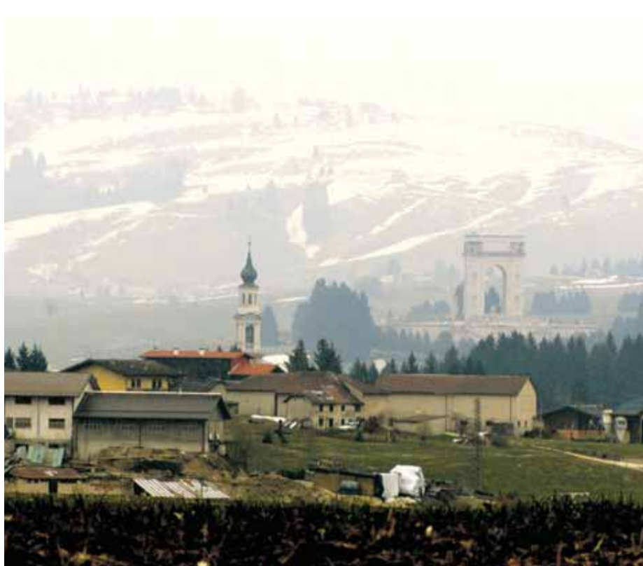
A destra, veduta di Asiago con il campanile del Duomo e l'ossario. Sotto, Camporovere con i primi fiori di zafferano alpino spuntati sui campi.

▶ Salendo in Altopiano venerdì 26 e sabato 27, il vescovo Antonio trova ancora qualche chiazza di neve, eredità di un inverno (per questa volta) generoso per il turismo e l'economia. Generoso com'è stato l'ultimo quinquennio per un vicariato che ha camminato insieme in modo davvero intenso. La visita pastorale coincide con la conclusione del mandato dei consigli pastorali e del coordinamento vicariale e rappresenta un'occasione privilegiata di verifica.